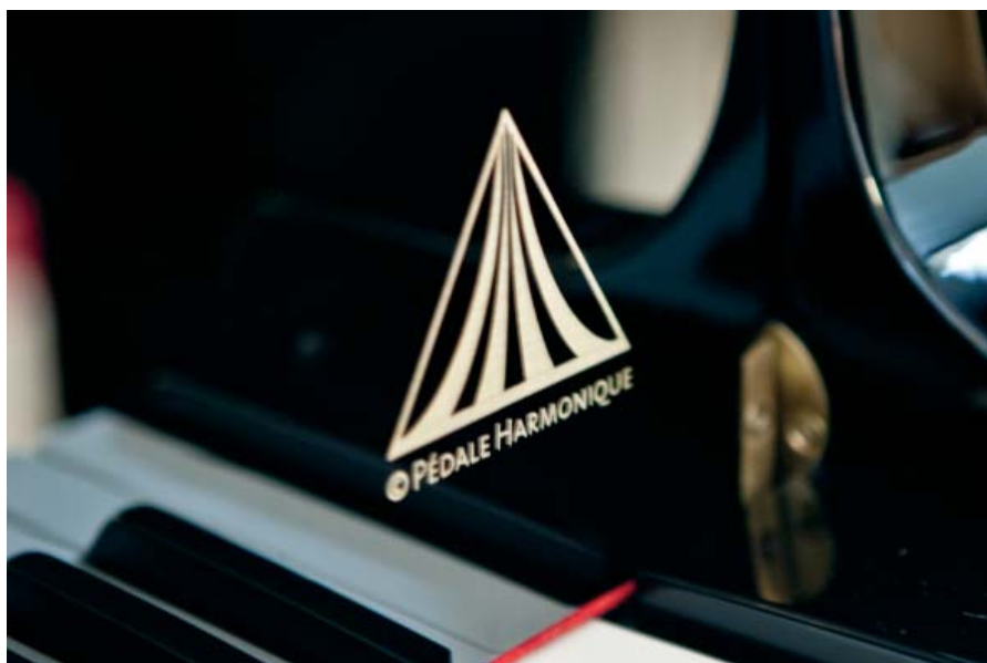
Pedał harmoniczny – logo

Najwyższej jakości materiały do produkcji instrumentów, staranność wykonania, oferta dopasowana do potrzeb klienta, życzliwość, lojalność i uczciwość wobec odbiorców i współpracowników – to właśnie jest klasa i styl Feurich.