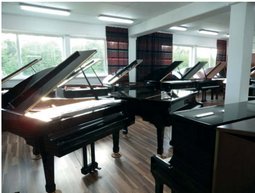
Salon w Fortepiano Center

tepiany i pianina produkowane w fabryce fortepianów i harf Enzenauer w Niemczech. Nowością są także fortepiany i pianina z okuciami chromowymi oraz podnóżki z pedałami dla dzieci.