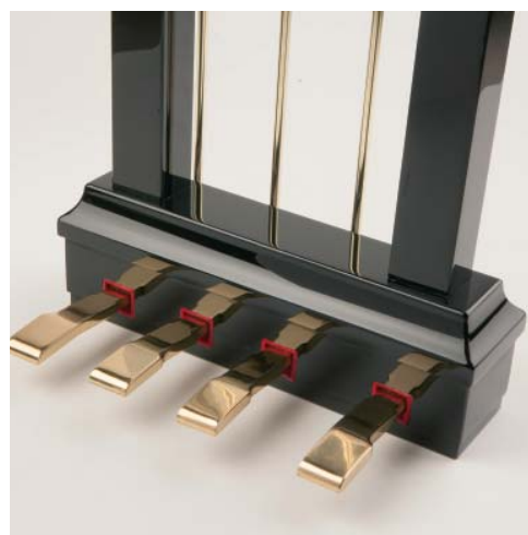
Lira fortepianu z pedalem harmonicznym