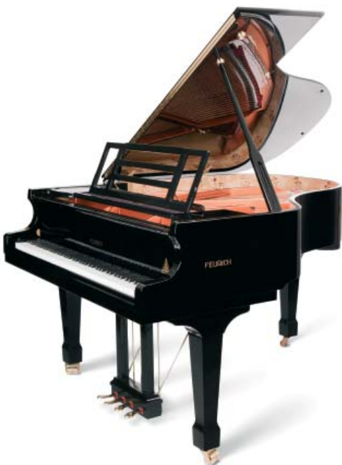
Fortepian Feurich mod. 178 Professional II z czwartym pedałem harmonicznym. Model wyróżniony nagrodą Diapason D'or